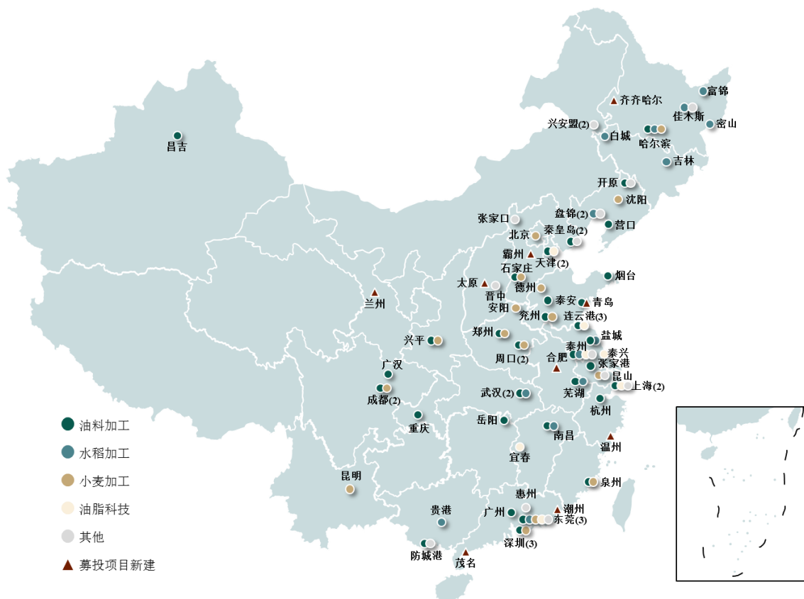
益海嘉里生产基地示意图（截至 2019 年 12 月 31 日）

截至 2019 年 12 月 31 日，发行人在全国 24 个省、自治区、直辖市拥有 65 个已投产生产基地。其中，发行人在武汉有两个生产基地，分别为油料加工基地和水稻加工基地，其余生产基地皆在湖北省以外地区。